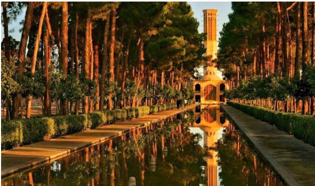
یزد - نمونه پردیس ایرانی

در این راستا نه تنها باغها از موقعیت شهری تاثیر پذیرفته‌اند بلکه شهر و مجموعه‌های شهری نیز تحت تاثیر باغ یا مجموعه باغها قرار گرفته و حتی گاه استخوانبندی محورهای اصلی شهر را شکل بخشیده‌اند.