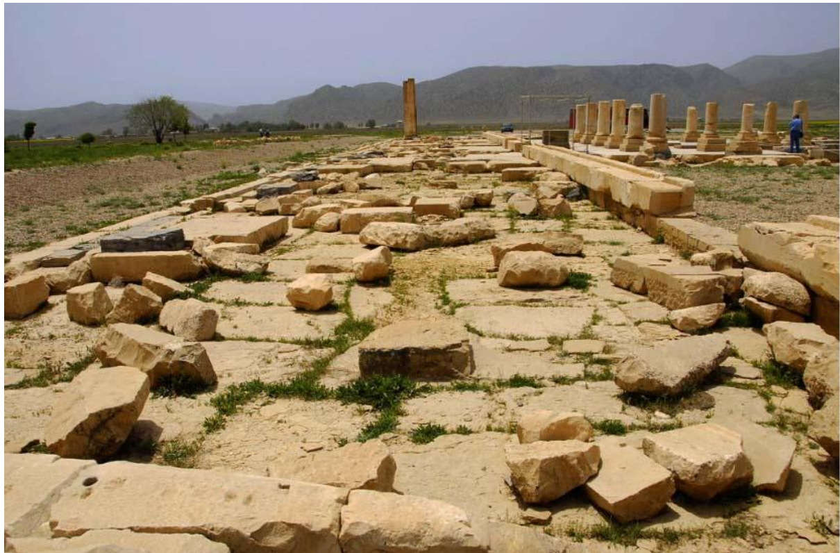
پاسارگاد - پردیس ایرانی مربوط به دوره هخامنشیان

پردیس اخیراً کشف شده از پاسارگاد که احتمالاً اولین طرح اجرا شده از "باغ اندر باغ" عظیم شهر - پایتخت ناتمام کورش بوده و نیز وصف پردیس کورش جوان در شهر ساتراپ نشین غرب ایران که گزنفون نقل می‌کند، دیگر نمونه‌هایی کافی برای نمایش ولو نه خیلی روشن از رابطه ساختار باغ و شهر در شهرهای طراحی شده هخامنشیان می‌باشد، بدون جهت نبود که یونانیان هخامنشیان را بزرگترین باغسازان جهان میدانند.