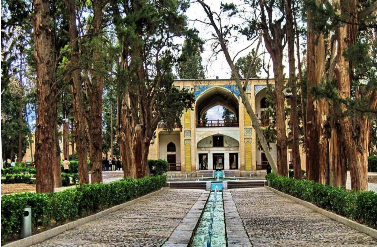
کاشان - پردیس ایرانی به نام فین

درختان و گلهای معمول در باغهای دوره قاجاریه تقریباً همانند دوره معاصر است. درختکاری و گلکاری باغها در اوایل دوره قاجاریه هنوز غالباً به شیوه قدیم ایرانی بوده است ولی به تدریج گلکاری فرنگی بویژه در دوران پادشاهی ناصرالدین شاه رایج گردیده و گلکاران و باغبانان فرنگی هم به ایران آمده و شیوه گلکاری غربی را با خود آورده اند.